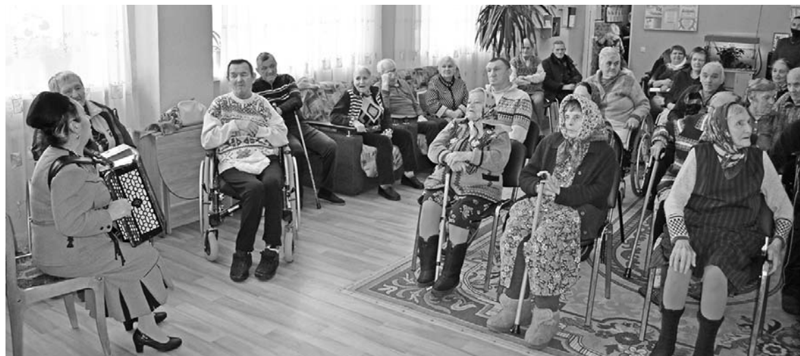
Праздник в Доме-интернате.

Праздничная программа продолжалась полтора часа. Проживающие тоже блеснули талантами — со сцены читали стихи.