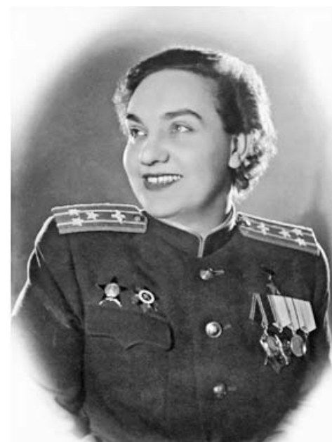
В 2020 году Союз женщин России учредил памятную медаль имени Валентины Гризодубовой, отметив таким образом 110-летие со дня её рождения.

Легендарная летчица ушла из жизни 28 апреля 1993 года в возрасте 84 лет. В Москве ее именем названа улица. У входа в Московский научно-исследовательский институт (ныне концерн «Вега») в 2000 году установлен памятник. В Москве, Минске, Санкт-Петербурге имя легендарной летчицы присвоено школам.