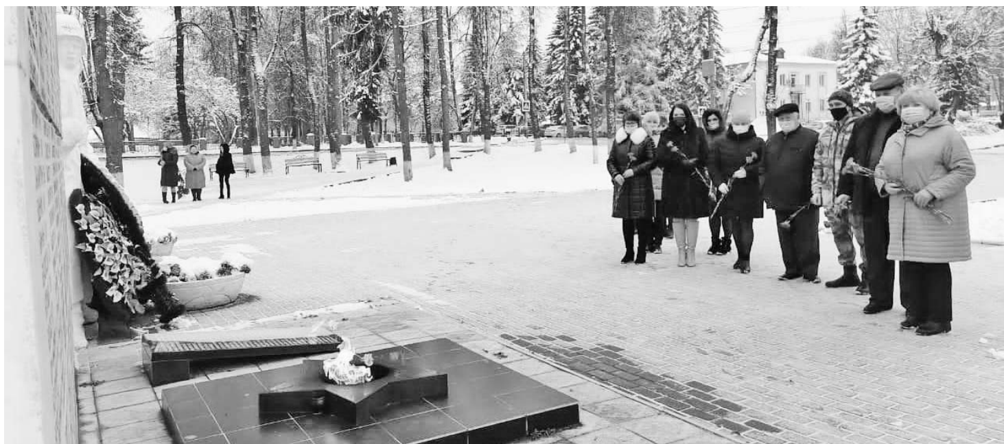
Думиничане у Вечного огня: помним, гордимся!

На границе поселков Снегири и Ленино Истринского района в ноябре 1941 года 9-я гвардейская дивизия генерала Афанасия Павлантьевича Белобородова остановила рвавшуюся к Москве танковую колонну немцев, которым до Красной площади оставался один бросок – чуть более 40 километров.